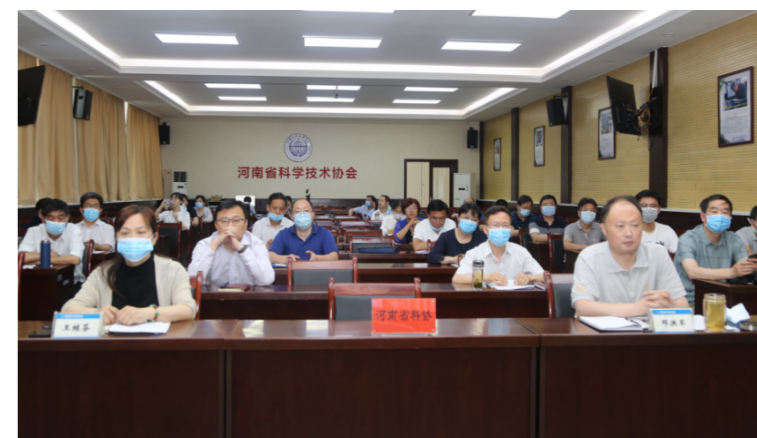
中国科协“科创中国”试点建设视频座谈会河南分会场

在河南分会场参加会议。省科协相关部门、直属事业单位负责人，郑州市科协学会部负责人及相关学会代表在分会场参加会议。