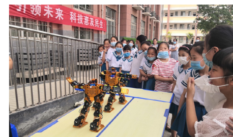
同学们围在一起观看机器人表演