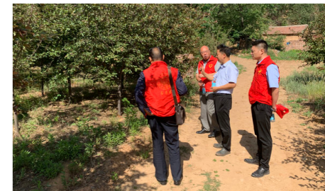
科技专家对基地负责人和技术人员进行指导和培训