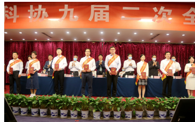
颁发第十四届河南省青年科技奖

曹奎指出，2020年是决胜全面建成小康社会、打赢脱贫攻坚战、实现“十三五”规划收官之年，也是贯彻落实省科协九大部署、开创新时代全省科协工作新征程的关键之年。全省各级科协组织要坚持以习近平新时代中国特色社会主义思想为指导，全面加强党对科协工作的领导，坚持“建载体、搭平台、创新体制机制”工作思路，坚持“高站位、高标准、高质量”工作要求，以提升科协工作影响实效为主线，把“强三性”融入“四服务”，在凝聚科技界智慧上用真功，在科协工作平台化品牌化上做文章，在助力全省重大战略实施上见成效，推动省科协九大各项部署落地落实，在工作实践中实现“组织赋能、数据说话、结果证明”，奋力开创全省科协工作高质量发展新局面，为谱写新时代中原更加出彩绚丽篇章作出新贡献。