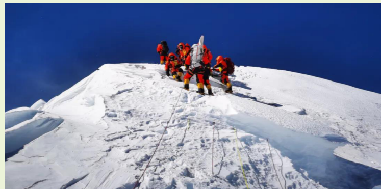
5月27日，2020珠峰高程测量登山队成功登顶世界第一高峰——珠穆朗玛峰

攀登珠峰如此艰险，为什么在科技如此发达的今天，还需要人登顶去给珠峰测高？山峰高度的测量是世界性难题吗？能用无人机等设备代替人工进行测高吗？测量珠峰高程有什么意义？