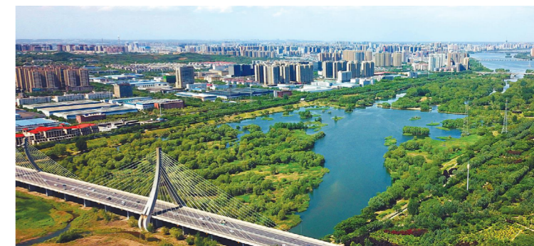
生态环境优美的洛阳高新区

近日，洛阳综合保税区正式获国务院批复同意设立，这是我省继郑州新郑综保区、南阳卧龙综保区、郑州经开综保区之后的第四个综合保税区。