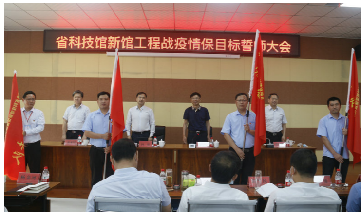
与会领导为四个党员突击队授旗

会前，省科技馆新馆工程建设指挥部领导实地察看了工程建设情况。会议对前一段工作进行了总结，对下阶段工作进行了部署。项目代建、总包、