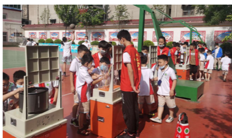
济源市2020年“流动科技馆进校园”活动现场