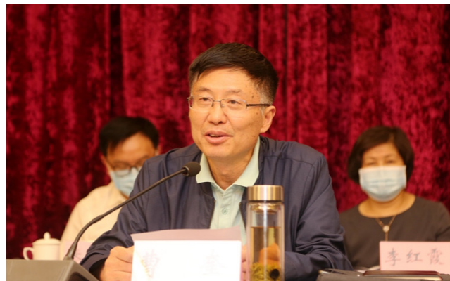
省科协党组书记、主席曹奎代表省科协常委会作工作报告