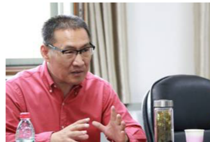
李建生，河南中医药大学副校长，教授。国家万人计划领军人才、岐黄学者、第六批全国老中医药专家学术经验指导老师，吴阶平医药创新奖获得者。

李建生多年来围绕诊疗规范、治疗方案技术、新药研发及呼吸道传染疾病等关键问题进行了创新性工作，为我国中西医结合防治呼吸疾病的科学技术发展作出了突出贡献，获得国家科技支撑计划、国家自然科学基金重点项目、国家公益性行业科研专项等8项，国家教学成果二等奖1项、教育部科技进步一等奖1项、河南省科技杰出贡献奖1项、河南省高等教育教学成果奖各1项，专利和著作权5项。以一作/通讯发表中文核心论文47篇、SCI收录23篇。