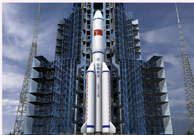
长征五号B运载火箭

5月5日，长征五号B运载火箭在文昌航天发射场首飞成功，空间站阶段飞行任务首战告捷，我国载人航天工程“第三步”任务序幕正式拉开。5月8日，我国新一代载人飞船试验船返回舱在东风着陆场预定区域成功着陆，试验取得圆满成功。对于中国载人航天来说，这是圆梦的过程，更是追梦的征途。从仰望星空到遨游星汉，中国航天人将一个又一个梦想变为现实，极大地推动了科技进步。