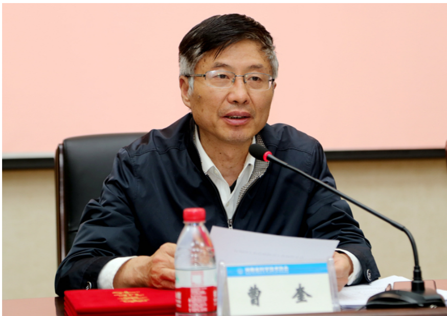
省科协党组书记、主席曹奎出席会议并讲话

2019年，全省各级科协组织认真学习贯彻省委办公厅、省政府办公厅新时代科普工作意见，建载体、搭平台、创新体制机制，全省科普工作和全民科学素质建设工作呈现出快速发展态势，打造了不少新亮点，取得了很多新突破。比如：科普信息化工程已覆盖55个县（市、区），送科技“进村、入户、到人”的信息化科普网络织得更密；“科普大篷车走进伏牛山走进贫困县”