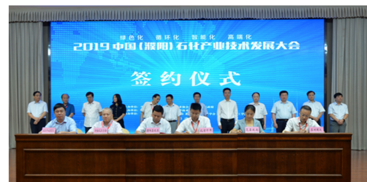
2019中国（濮阳）石化产业技术发展大会签约仪式现场

省科协将围绕濮阳石化产业特别是生物基材料产业发展需求，积极协调对接相关全国学会和全省学会，共建濮阳市生物基材料研究院等合作平台，联合召开产业技术发展大会、制定产业团体标准，协同开展科技攻关，共同打造“会展赛服+团体标准”全国示范模式，示范带动我省科技经济深度融合发展。