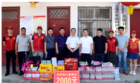
漯河市科协为英张村送去慰问品和慰问金