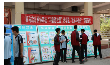
学生们在宣传展板前驻足观看