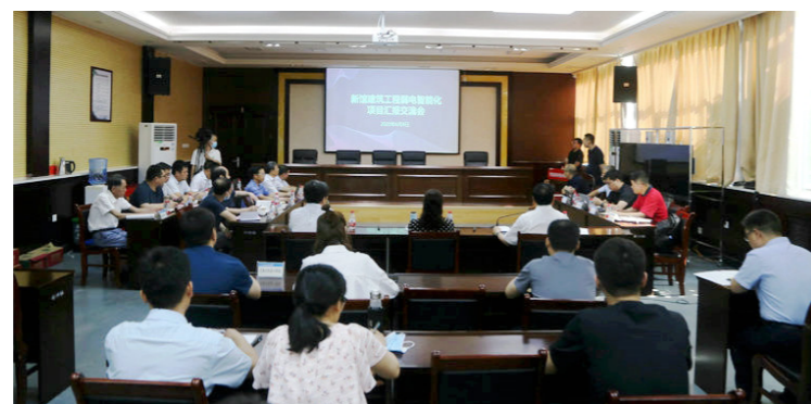
省科协领导与新馆建筑工程参建单位进行探讨交流

会议指出，弱电智能化工程是一项技术含量高、施工难度大的系统工程，直接影响着新馆建筑工程安全、高效、便捷、节能、环保、健康的建筑环境目标的实现。施工单位要严格对标“国际一流、国内领先”的建馆目标，研究吃透智能化工程家底内容，精心编制施工方案，科学规划系统集成，严格设备质量管理，优选最新技术成果，将精