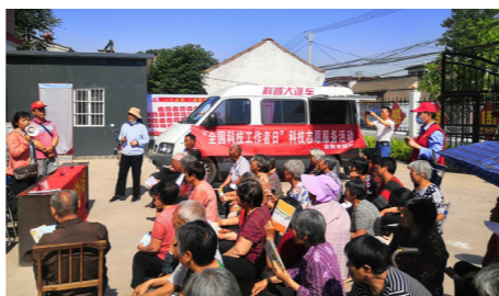
科技志愿者为群众现场授课